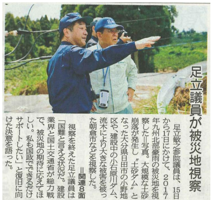
足立議員が被災地視察

足立敏之参院議員は、15日から17日にかけて、2017年九州北部豪雨の被災地を視察した。写真、大規模な土砂崩落が発生し、「土砂ダム」となった大分県日田市の小野地区や、建設中の小石原川ダム、流木により大きな被害を被った朝倉市などを視察した。