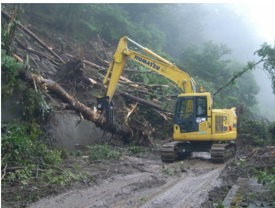
北杜藤見線の土砂崩落による応急復旧作業 （一社）山梨県建設業協会