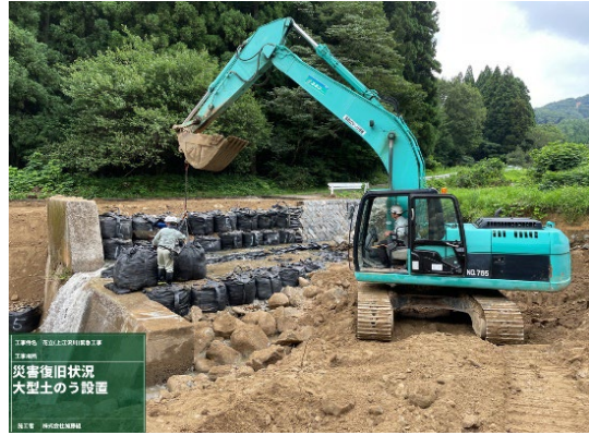
上江沢川での土石流による緊急復旧作業 （一社）新潟県建設業協会