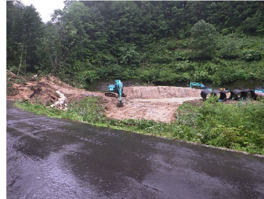
国道105号線土砂撤去、仮設道路設置 （一社）秋田県建設業協会