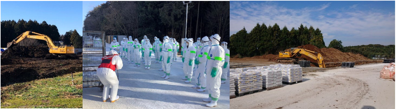
【鳥インフルエンザ】城里町の養鶏場の防疫措置での埋却箇所掘削及び埋却作業