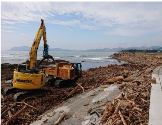
延岡港海岸で台風14号による漂着物撤去 （一社）宮崎県建設業協会