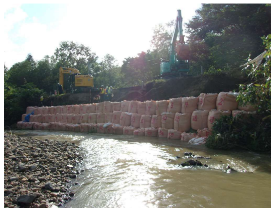
道道の遠別中川線で道路法面復旧作業 （一社）北海道建設業協会