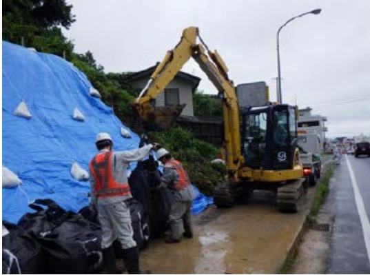
国道4号土砂流出による撤去等作業の様子 （一社）宮城県建設業協会