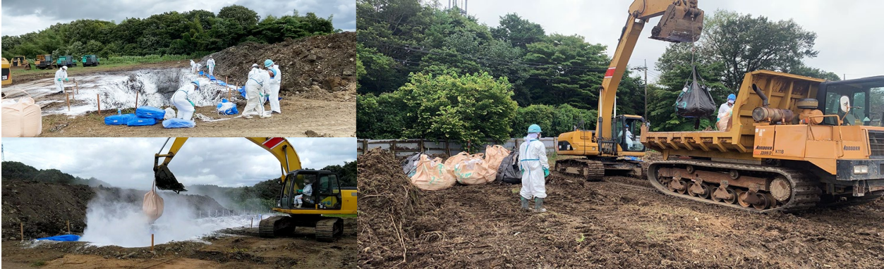
【豚熱】那須烏山市の養豚場の防疫措置での埋却箇所掘削および埋却作業