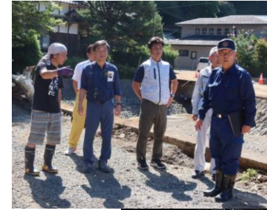
京都府舞鶴市における 中小河川の氾濫